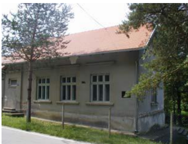
Slika 9: Škola Djedina Rijeka