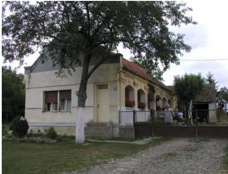
Slika 19: Kneževac k.br. 35

većoj mjeri je uzrokovano općim, posebno demografskim i ekonomskim, nazadovanjem sela, što je za posljedicu imalo nedostatno održavanje stambenih i gospodarskih zgrada. Ipak je na terenu zabilježeno i nekoliko iznimki od ovog općeg stanja. U takve primjere solidno održavanih tradicijskih zgrada treba ubrojiti zabatnu kuću u Sovskom Dolu, k.br. 43, kuću uzdužnog tipa u Imrijevcima, k.br. 34, zabatnu kuću u Kneževcu, k.br. 35 i kuću s tlocrtom „u ključ“ iz 1928. godine u Latinovcu, k.br..70