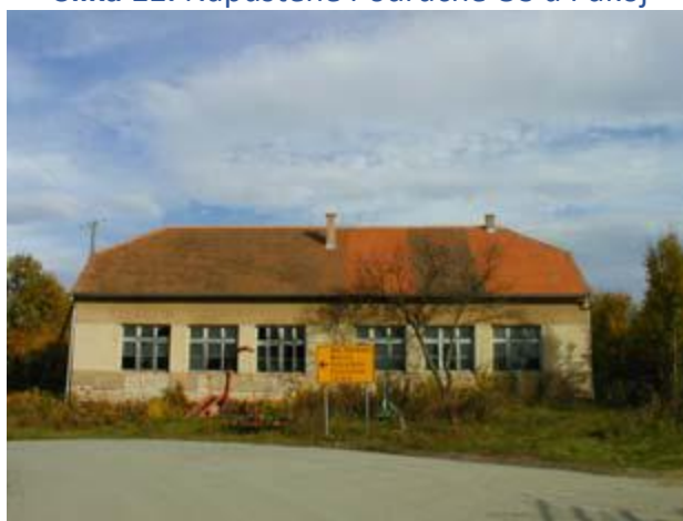
Slika 12: Zdenkovcu