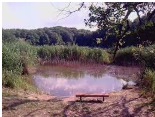
Slika 3: Sovsko jezero

Iako jezero nema bistru plavu boju, nego tamnu i u sredini crnu, ljepota je u tome što je uvijek mirno. Tek tu i tamo se zamreška voda sa sitnim ribicama kojim jezero obiluje. U njemu se gnijezde neke ptice močvarice, u jezeru i oko njega žive žabe, barske kornjače i bjelouške, a od riba karas. Dno jezera prekriveno je muljevitim naslagama. Dubina jezera nije točno utvrđena, neka istraživanja su pokazala da je duboko od 14 do 44 m.