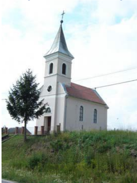
Slika 23: Kapela Gospe od Krunice u Milanlugu

Kapela Gospe od Krunice u Milanlugu sagrađena je 1934. godine na uzvisini uz cestu za Čaglin. U pročelju se ističe blago rizalitno naglašen zvonik, sa svake strane zvonika je valovita atika. Zvonik završava piramidalnom kapom.