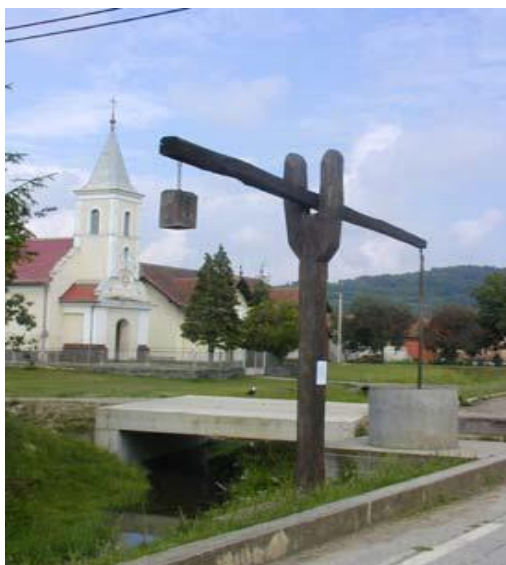
Slika 24: Crkva sv. Mihovila u Djedinoj Rijeci

Crkva svetog Mihovila sagrađena je u Djedinoj Rijeci. Predložena je za zaštitu u popisu kulturnih dobara.