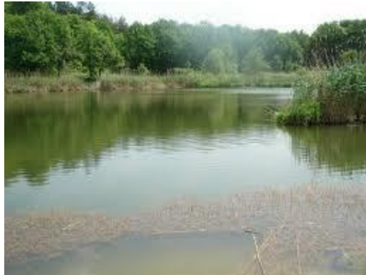
Slika 28: Sovsko jezero

Jezero brdo, na vrhu kojega je piramida Vidikovac. Na sjeverozapadu ova udolina je otvorena i preko nje za vrijeme velikih voda istječe višak jezerske vode.