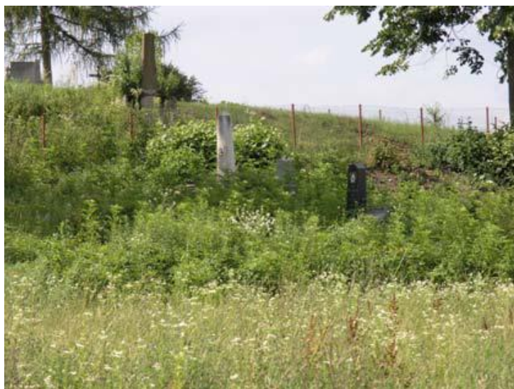
Slika 27: Ruševo - Pogled na ostatke židovskog groblja

Spomenički važno na području Općine je i dio židovskog groblja koje se, iako u sklopu katoličkog groblja, nalazi izvan prostora groblja ograđenog žičanom ogradom. Od nekadašnjeg groblja ostalo je svega nekoliko grobova sa spomenicima, a neki spomenici su porušeni. Područje uz ogradu potrebno je očistiti od raslinja, te istražiti uz prisutnost nadležnog konzervatora. Smještaj grobova pokojnika druge vjeroispovijesti izvan ograđenog prostora groblja govori o kulturnom i civilizacijskom nivou, te brizi o nasljeđu.