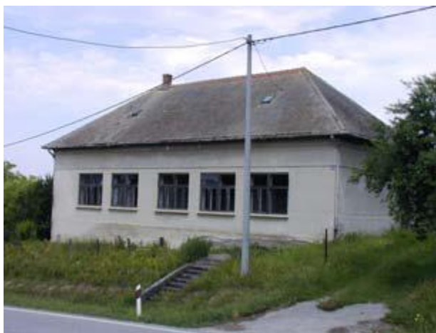
Slika 13: Migalovcima