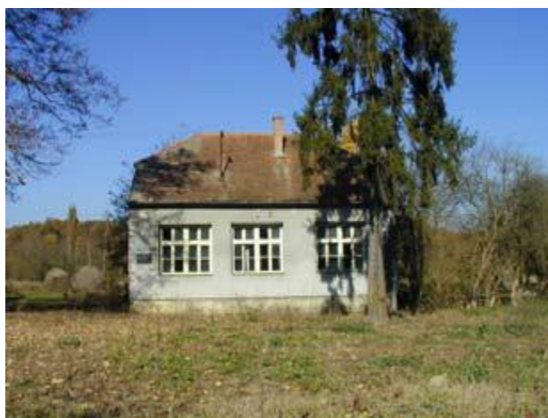
Slika 11: Napuštene Područne OŠ u Pakoj

U pojedinim naseljima u Općini (Zdenkovac, Migalovci, Imrijevc, Paka i dr.) sada postoje napuštene i u vrlo zpuštenom stanju zgrade Područnih odjela osnovnih škola u kojima se nekada obavljala nastava za prva četiri razreda osnovne škole.