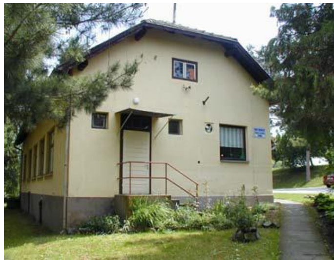
Slika 14: Čaglin Dom zdravlja

U naselju Čaglin nalazi se jedna privatna ljekarna u sastavu 1 mr. farmacije i 1 farm. tehničar.