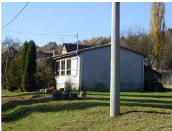
Slika 7: Područni odjeli OŠ u: Sovskom dolu