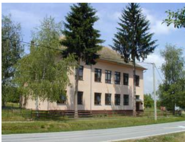
Slika 8: Škola Ruševo