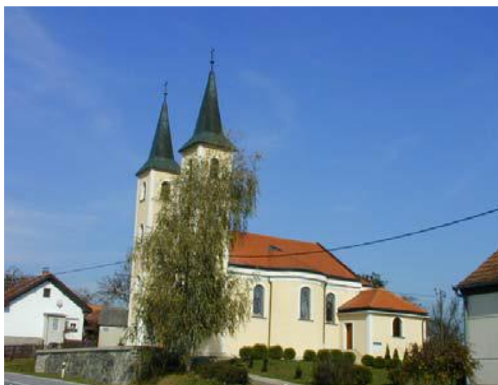
Slika 21: Župna crkva sv. Alojzija Gonzage u Čaglinu

Župna crkva svetog Alojzija u Čaglinu sagrađena je 1763. godine. Smještena je na uzvisini tako da svojim položajem dominira širim krajobrazom i predstavlja u kulturološkom i urbanističkom smislu jednu od najvažnijih točaka prostora Općine. Izgrađena je kao jednobrodna građevina s dva zvonika na pročelju i dvjema polukružnim bočnim kapelama.