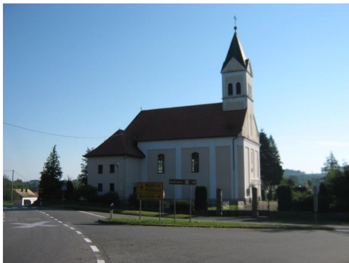
Slika 22.: Župna crkva Uzašašća Isusovog u Ruševu