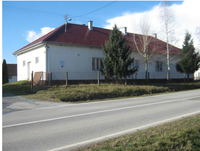
Slika 15: Veterinarska ambulanta Čaglin