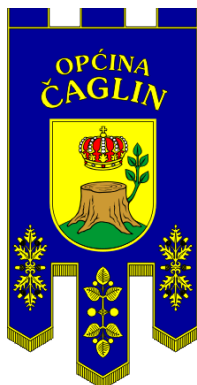
Slika 2. Zastava općine Čaglin

njega izrasta simbol je prosperiteta mlade općine. Za krunu se kaže da je atribut sv. Alojzija Gonzage, zaštitnika Čaglina, iako su češći atributi ovog sveca ljiljan i lubanja.