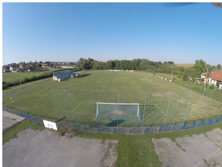
Slika 17: Igralište NK Omladinac Čaglin

Od građevina za šport i rekreaciju, otvorenih i zatvorenih sportskih terena zastupljeni su: nogometna igrališta u Čaglinu, Djedinoj Rijeci, Milanlugu, Ruševu, Sovskom Dolu i Novoj Ljeskovici, te košarkaško, odbojkaško i rukometno igralište u Čaglinu.