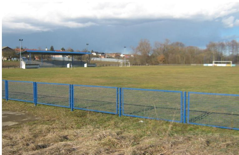
Slika 16: Igralište NK Omladinac Čaglin