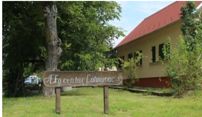
Slika 4: Eko centar Latinovac