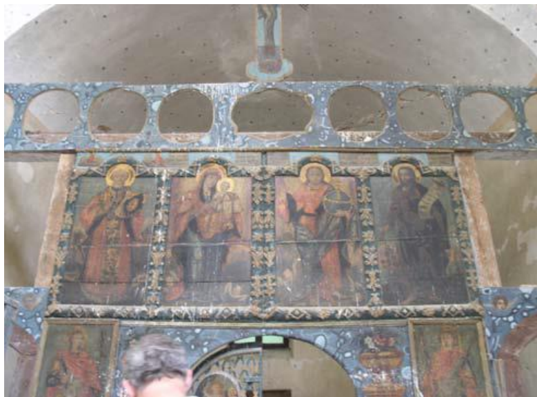
Slika 25: Unutrašnjost Pravoslavne crkve sv. Petra i Pavla

Pravoslavna crkva sv. Petra i Pavla u naselju Paka sagrađena je 1797. godine kao jednobrodna građevina sa zvonikom ukomponiranim u pročelje.