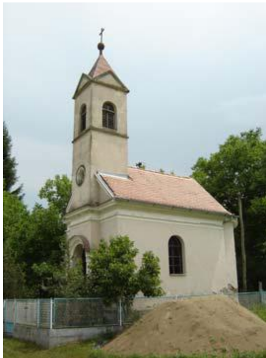
Slika 23: Kapela sv. Martina u Paki

Kapela sv. Martina u Paki sagrađena je 1926. godine na mjestu stare crkve sv. Pavla. Riječ je o jednobrodnoj građevini sa zvonikom ukomponiranim u pročelje. Nad ulazom u crkvu polukružnog završetka je okulus. Zvonik završava piramidalnim krovom.