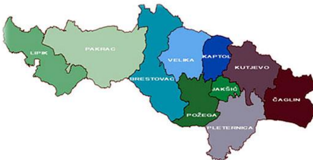
Karta 1. Požeško-slavonska županija

Glavne su rijeke Orlava, Lončža, Pakra i Bijela, koje pripadaju savskom porječju.