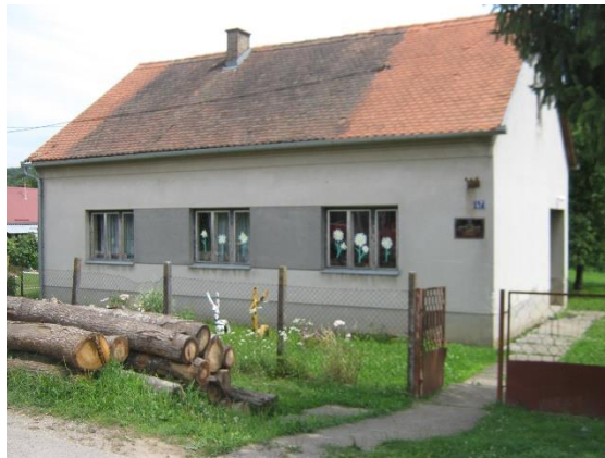
Slika 10. Škola Ljeskovica

Na području općine Čaglin nema niti jedne srednje škole .