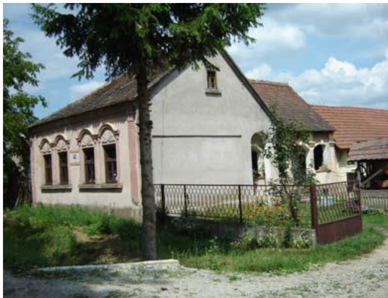
Slika 20: Latinovac k.br. 70. kuća iz 1928. godine