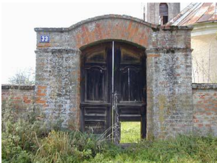
Slika 26: Pravoslavna crkva Velikomučenika Georgija

Pravoslavna crkva Velikomučenika Georgija u Latinovcu smještena je u centru sela. Crkva je opasana cinktorom koji je djelomično razrušen.