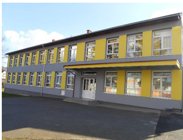
Slika 6/7: Osnovna škola Stjepana Radića Čaglin